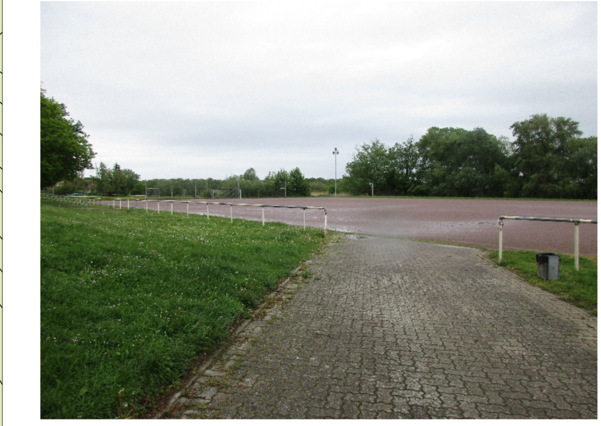
Sportplatz hinter der Mehrzweckhalle