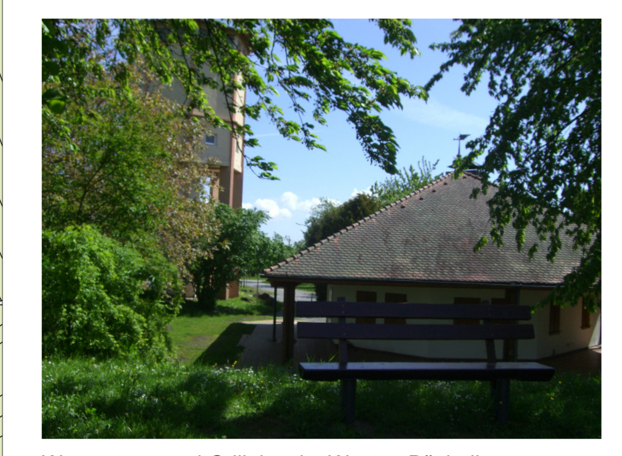
Wasserturm und Grillplatz im Westen Büchelbergs