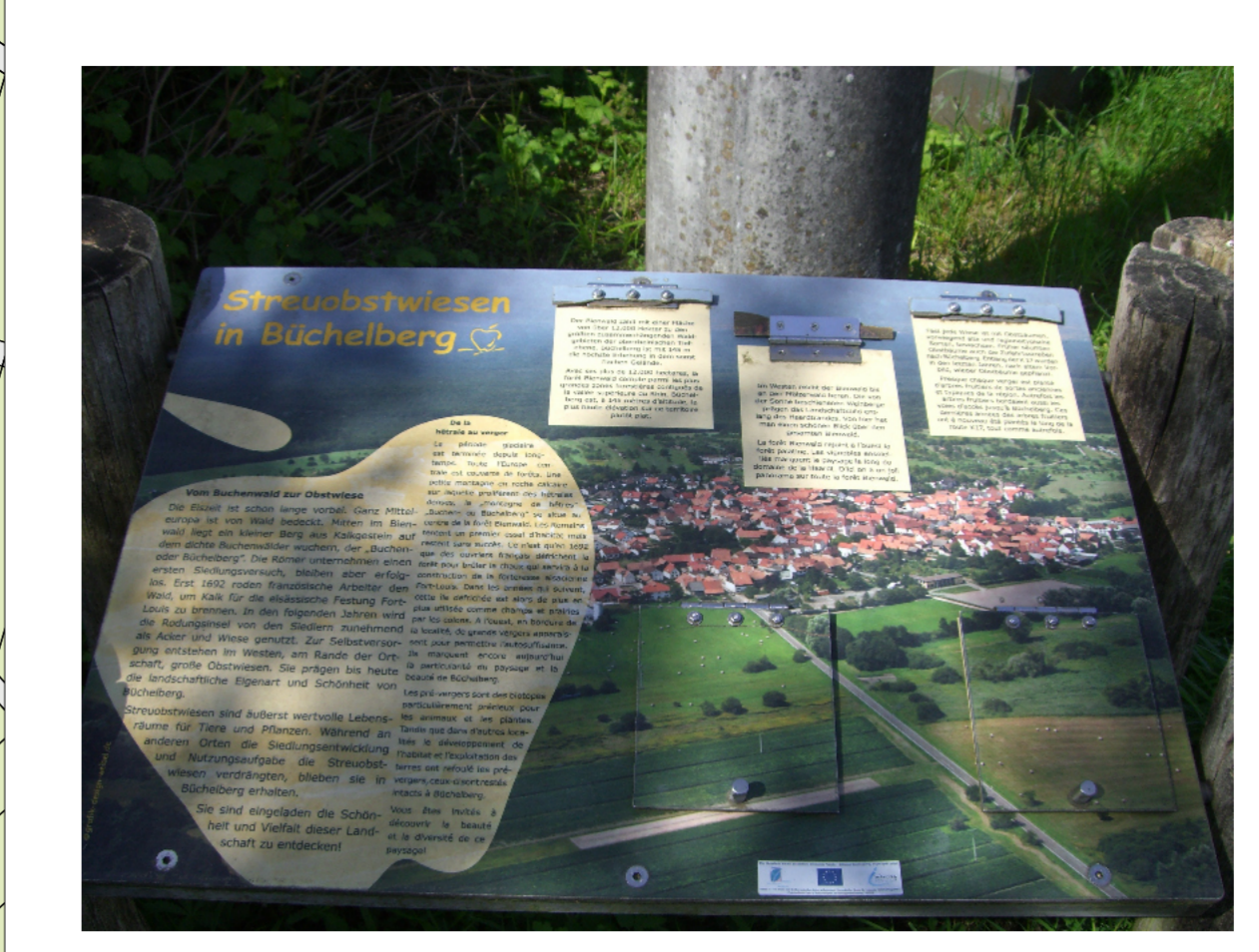
Erlebnispfade zu Streuobst und Bienen